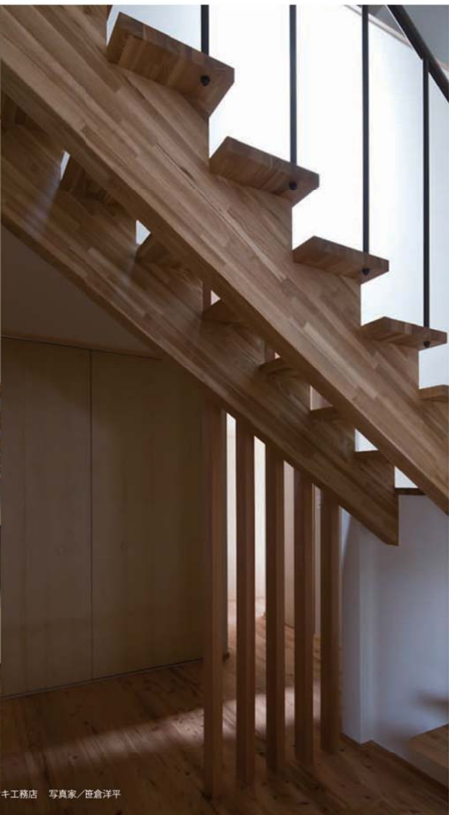
1部 設計/株式会社マサキ工務店